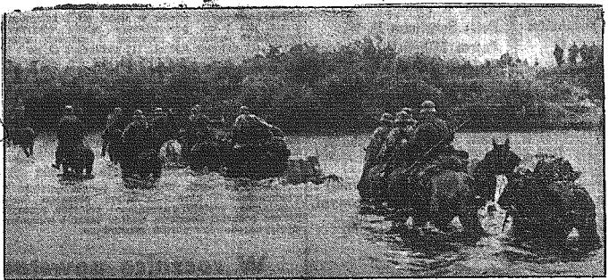
Pod ochroną karabinów maszynowych przechodzi kawaleria niemiecka jedną z rzek na Wschodzie