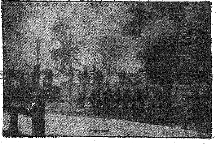
Znów padło jedno z osiedli na Wschodzie. — Plechota niemiecka, po przygotowaniu artylerijsko lotniczym, zdobyła je szturmem.

Z dniem 7 września zakazane zostało w Rumunii jakiegokolwiek używanie samochodów dla celów prywatnych. Samochody mogą być używane jedynie dla celów zawodowych. Równocześnie zarządzono zamknięcie wszystkich autobusowych linii komunikacyjnych biegnących równoległe do linii kolejowych. Ponadto wprowadzono szybki maksymalnie dla pojazdów mechanicznych.