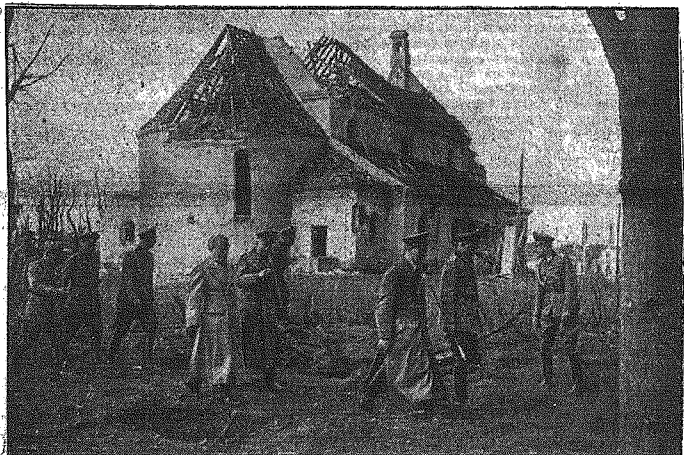
Jeszcze jedno zdjęcie do spotkania Hitler — Mussolini w Kwaterze Główniej na Wschodzie. — Obaj wodzowie mocarstw się przechodzą w otoczeniu swej świąty okno zniszczonego przez bolszewików kościoła.

Dzisiaj wiele się już zmieniło w starej Europie a święty powiew kieruje zwycięskim pędem armii europejskich na wschód, tak, że odnosi się wrażenie jak gdyby cień Boga przesunął się po ziemi.