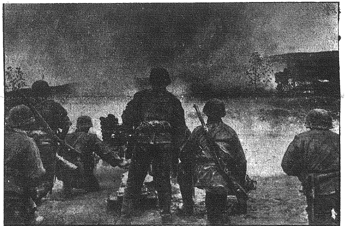
Gniazdo oporu bolszewickiego zostaje rozbite. — Po przygotowniczym ostrzeliwaniu z małego działka piechota niemiecka uderzy do szturm.

Kraków, 13 sierpnia. — Niemiecka Poczta Wschodnia podaje do wiadomości,