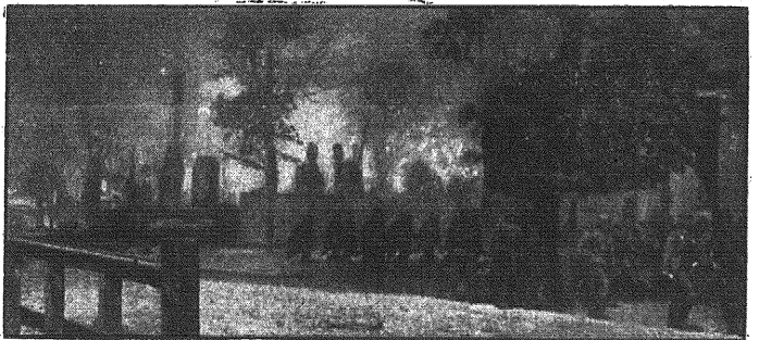
Oczyszczanie zdobytego miasta z morderców czerwonej armii. Silne patrole piechoty maszerują ulicami.

że została podjęta z Lwowem komunikacja telefoniczna. Na razie dopuszczone są jedynie rozmowy treści państwowej i urzędowej. Tymczasowo mogą być zatem prowadzone rozmowy państwowe i służbowe oraz nadawane depezo urzędowe. W związku ze szkodami, jakie na terenach Galicji powstały wskutek działań wojennych, porozumienie się w drodze telefonicznej z tutejszymi miejscowościami jeszcze nie jest korzystne. Trzeba będzie jeszcze uplywn pewnego okresu czasu zanim zyska się możliwość porozumiewania w drodze telefonicznej w takich korzystnych warunkach, jak to ma miejsce w pozostałej części Generalnego Gubernatorstwa. Dla tego zaleca się w najbliższym okresie nie korzystanie w szerokim zakresie z połączeń telefonicznych.