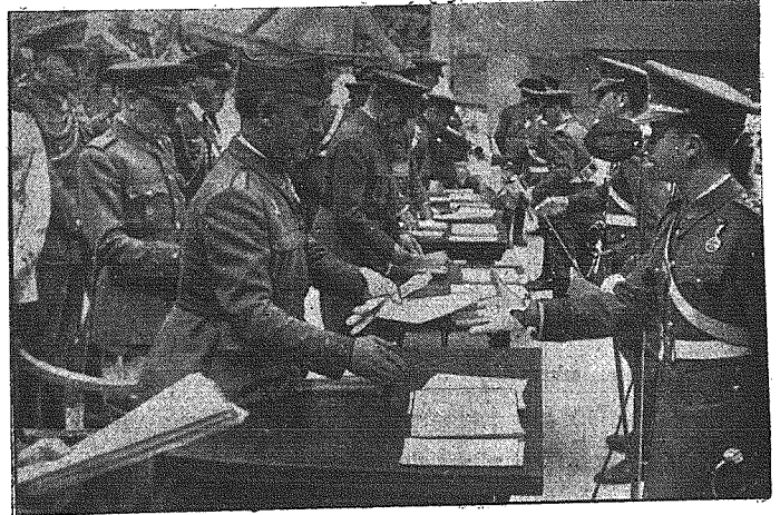
Pasowanie nowoczesnych rycerzy. — Wśród historycznych ruin Alkazaru gen. Franco doręcza podchorążym nominacje oficerskie.

nic benzyny. Nie mniejsze i bardzo i krwawe straty zadano licznym sowieckim kolumnom marszowym. Poza tym niemieckie samoloty bojowe dokonały bardzo skutecznej akcji, bombardując ważny węzłowy punkt kolejowy, leżący w wielkim kolanie rzeki Dniepru, w okolicy Dniepropetrowska. Zarówno dworzec kolejowy, jak i tory, na których znajdowało się 10 długich pociągów towarowych, zostały formalnie zarzucone pociskami bombowymi, a teren ten w okamgnieniu zamienił się w istne piekło ognia, dymu i czadu spaleniźny. Wszystkie stojące tam pociągi doszczętnie spłonęły.