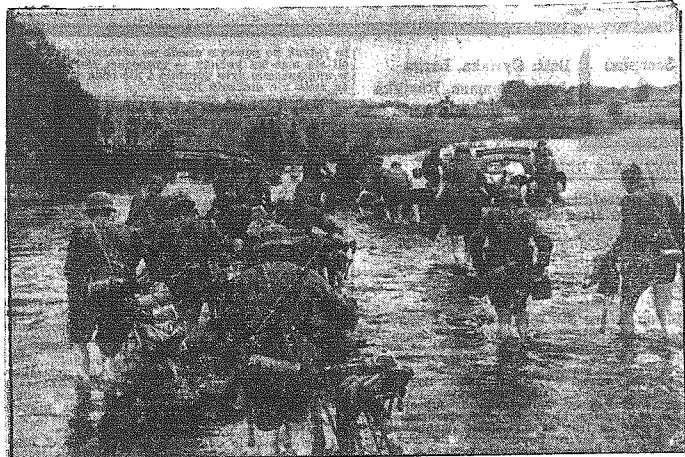
Żołnierze niemieccy w przeprawie przez rzekę