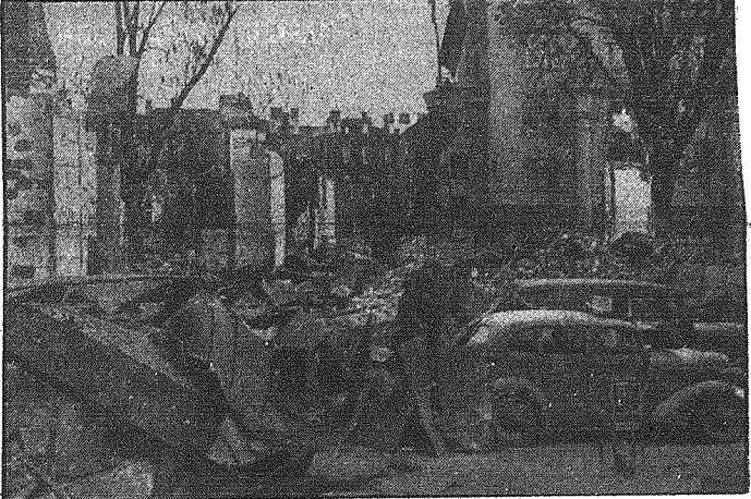
Tak wygląda Smoleńsk po ucieczce bolszewików

W tych dla przeciwnika niezmiernie obfitujących w straty walkach wojska węgierskie i słowackie, stojąc w wiernym braterstwie broni ramie przy ramieniu z niemiecką siłą zbrojną, wzięły wybitny udział. Równocześnie z tymi oddziałami wojska niemiecko-romuńskie pod naczelnym dowództwem generała Antonescu przezwyciężyły silnie broniony Prut, oswoiła Bessarabię mimo zaciekłego oporu i bezdrożnego terenu. Następnie armia generała pułkownika Rittera