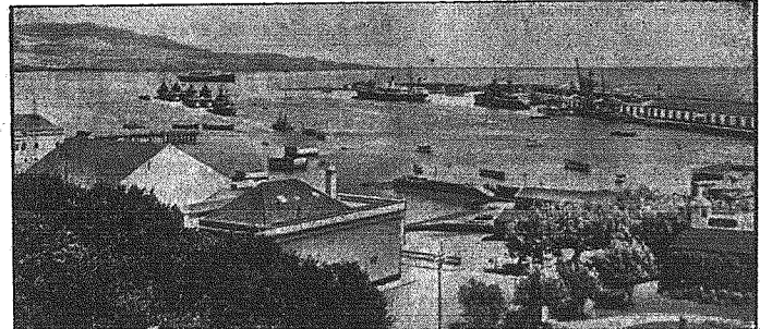
Dwa porty - na które spogląda świat

Ataki powietrzne na ośrodki komunikacyjne i zbrojeniowe w Moskwie i okolicy Berlin, 4 sierpnia. — W ciągu ostatnich dni lotnictwo niemieckie kilkakrotnie bombardowało z nadzwyczajnym skutkiem ważne ośrodki komunikacyjne i zbrojeniowe w Moskwie i okolicy. Spośród zaatakowanych miejscowości chodzi tu przede wszystkim o węzeł kolejowy Orzeł oraz o dzielnicę moskiewską, położone na północ od Śródmieścia i na wschód od łuku rzeki Moskwy. Orzeł leży na przecięciu się linii kolejowej Moskwa — Charków i Brjańsk — Jelos. Atak na Orzeł ma znaczenie o tyle, iż po dokonaniu już nalocie na węzeł kolejowy poniżej Brjańska, mniej więcej 150 km na zachód od Orła, zaatakowano daleką ważną miejscowość na szlaku linii kolejowej północ-południe, która niezależnie od transportów wojskowych ma przede wszystkim niesłychanie ważne znaczenie dla transportów z centralnych rejonów przemysłowych Unii Sowieckiej, a przede wszystkim dla transportów węgla, żelaza i produktów rolniczych.