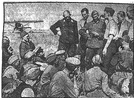
Na zdobytym lotnisku. — Lotnicy niemieccy i jeńcy czerwoni.