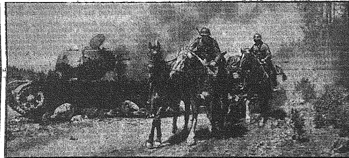
Marz na Wschodzie trwa. — U góry: Wysadzone mosty nie są przeszkodą. Podczas gdy saperzy budują nowe, kolumny niemieckie posuwają się przez pola. — U dołu: W kilka minut po rozbiću czołgów sowieckich, artyleria niemiecka galopuje na nowe stanowiska.