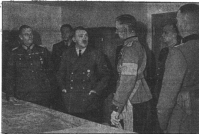
Fiński general Harold Oshquist został przyjęty w Kwaterze Głównej Kaibel. Hitlera

jednostki ubezpieczające wyrzuciły niezliczoną ilość bomb wodnych, a konwojowane okręty handlowe starały się uciec w różnych kierunkach. W czasie szalonej pogoni, trwającej dwa dni i dwie noce, zostały pojedynczo łodzie podwodne po skutecznym zatripieniu licznych statków przez nieprzyjacielskie kontrtorpedowce i korwety przejściowo odparte. Lecz te nie dały za wygraną i ponownie zaatakowały konwoj, przy czym trafiły celną torpedą jeden kontrtorpedowiec oraz jedną korwetę tak, iż okręty te zatonęły. W ten sposób łodzie podwodne stale ponawiały swe ataki, nie pozwalając nieprzyjacielowi wychnąć ani na chwilę. Transport konwojowany rozpadł się na pojedyncze grupy, z których każda stała się celem nowych ataków niemieckich łodzi podwodnych. Znowu celnymi pociskami zatripiiono naładowane po same brzozy statki handlowe. Nad ranem drugiego dnia ostatnie resztki transportu konwojowanego były rozbite. Do pola działań jednostek niemieckich dostały się w toku operacji nawet inne okręty, nie należące do transportu konwojowanego, a zaatakowanego pierwotnie przez niemieckie łodzie podwodne.