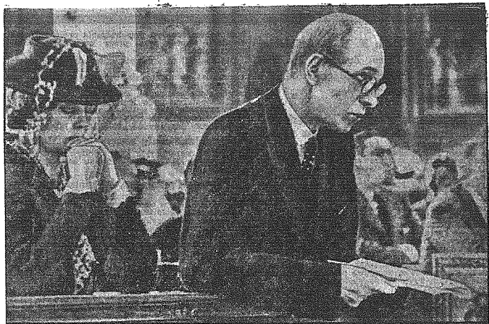
Halifax modlił się za bolszewizm. — Zdjęcie to dokonane zostało podczas niedawnego odprawionego nabożeństwa w katedrze Patryka w Nowym Jorku.