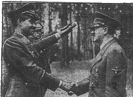
Kancelarz Hitler przyjął w Głównej Kwaterze pułk. Gallanda, przyjeżdżąc z nad Kanału La Manche

2 dywizje sowieckie całkowicie zniszczone