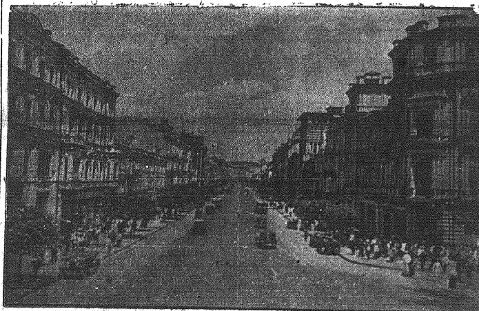
Na froncie wschodnim tworzą się ciągle nowe kotły, w których tworzeniu celuje wojskowa taktyka niemiecka. — Na zdjęciu Kijów, jedna z głównych ulic. — Kijów znajduje się w obrębie jednego z wyższych wspomnianych kotłów. Ze względów taktycznych Niemcy nie podają szczegółów, dotyczących oblężenia tego miasta.

Budapest, 28 lipca. — Do jakiego stopnia bolszewicy posunęli „woj cyrym” w stosunku do kościoła wynika z faktu, iż GPU użyło kościoła w Kamieńcu Podolskim jako