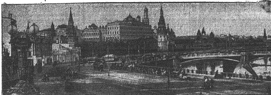
Widok na Moskwę i Kreml od strony Czerwonego Placu. — Już czterokrotnie Niemcy bombardowali to miasto, w odwecie za naloży bolszewickie na Bukareszt i Helsinki. Według doniesień neutralnych sprawozdawców, ludność Moskwy, podobnie jak Londynu, szuka schronienia w podziemiach „Metro“.

Aby le uzyskać, trzeba było pokonać dalekolegające kroki, celem przemieszczenia handlu z odciętych obszarów na obszary pozostałe. W ten sposób handel z państwami skandynawskimi, ze Wschodem z państwami bałkańskimi i z Włochami musiał się stać daleko intensywniejszym. Ponieważ jednak te kraje również były częściowo dotknięte na polu handlowym nieprzyjacielskimi krokami wojennymi, przeto zachodziła możliwość wzmożenia wywozu niemieckiego do tych krajów. Naturalnie zasada było w tym wypadku, żeby firmy produkujące na wywóz dostosowały się do zapotrzebowania powyż-