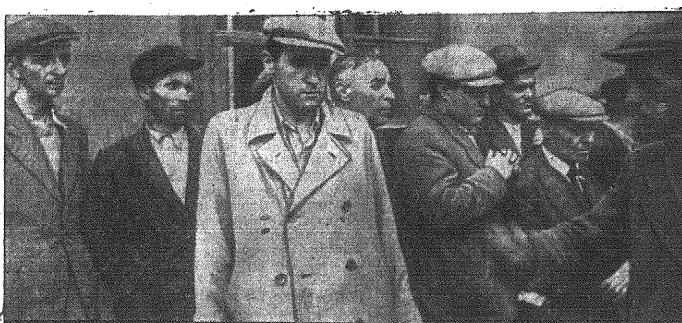
A to są żydzi-dennuncjanci, którzy kierowali masowymi morderstwami. Nie zdążyli oni uciec przed niemieckimi szafetami ochronnymi.

nym we włoskim komunikacie wojennym z soboty atakiem powietrznym na port lotniczy w Micabba na Malcie komunikują uzupełniająco w Rzymie ze strony urzędowej, że wśród maszyn zniszczonych na ziemi zapadło się 5 dwumotorowych aparatów typu „Vickers Wellington”, przy czym jeden z nich wyleciał w powietrze wraz ze swym balastem bombowym. W walkach powietrznych jakie się następnie wywiązały, wzięło udział także 100 samolotów, tak, że można je śmiało nazwać największym dotychczas starciem powietrznym w rejonie Morza Śródziemnego. W czasie tych walk zestrzelono liczne „Hurricane”, natomiast samoloty włoskie powróciły do swych baz wyjściowych.