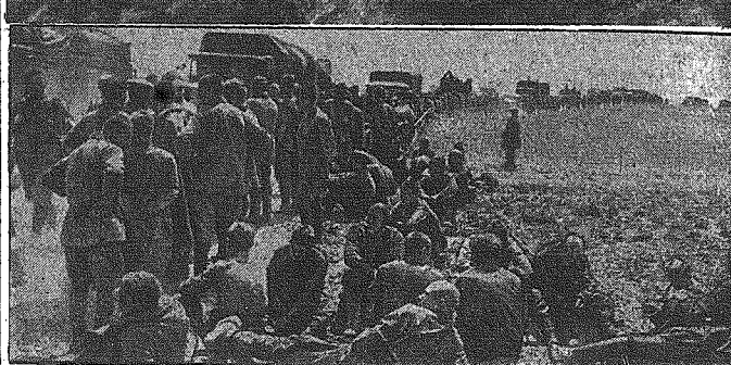
U góry: Płonące osady znaczą odwrót armii bolszewickiej. - W środku: Fort sowiecki po zdobyciu go szturmem. - U dołu: Wzdłuż dróg, w których posuwa się naprzód ofensywa niemiecka...