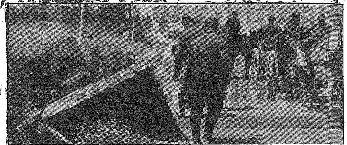
Po drogach leżą niezliczone zniszczone czołgi