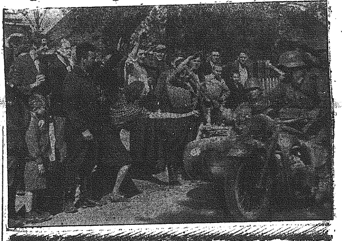
Polacy na Wileńszczyźnie witają entuzjastycznie wkraczającą wojska niemieckie, które przyniosły im oswobodzenie spod bolszewickiego jarzma.

W Sztokholmie zapytywano się, czy była to naiwna próba wpłynięcia w ten sposób na Niemców, czy też w archiwum płyt radiostacji moskiewskiej zapanowało już takie zamieszanie, iż nie można znaleźć tego, czego się potrzebuje.