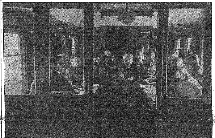
W rocznicę podpisania zawieszenia broni pomiędzy Niemcami i Francją

Tego samego popołudnia posłowie niezależni odbyli nadzwyczajne zebranie, na którym zatwierdzili nowy układ niemiecko-turecki.