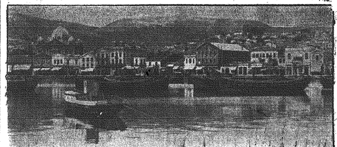
Widok na jeden z portów na Cyprze, który był ostatnio atakowany przez lotnictwo niemieckie

szłości nigdy nie wystąpią wrogo przeciwko sobie. W ten sposób narody niemiecki i turecki w nowostworzonej atmosferze pełnego bezpieczeństwa podały sobie na nowo doniosłe, istniejące już dotychczas traktaty o zobowiązaniu obu partnerów do wzajemnej niekłótni, a nadto zapewniono, że zobowiązania te nie stoją w sprzeczności z układem. Z radością przystępuję do podpisania tego układu, stanowiącego doniosły historyczny dokument przyjaźni, uważając przy tym za swój obowiązek podkreślić że szczególnym naciskiem cenne wysiłki mojej przyjaciela von Papena, znajdującego mo-