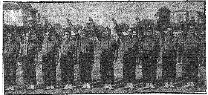
Nowa Syria — kraj, który krwawi dlatego, by Londyn mógł pochwalić się. Związek młodzieży, zorganizowana są na wzór europejski.

ge światowej opinii publicznej na komentarz dziennika angielskiego „News Chronicle” na temat wypadków syryjskich, który strona francuska uważa za nowy dowód cynicznych i brutalnych metod wojennych Anglii. Mianowicie „News Chronicle” m. in. napisał: „Francuzi stawiają w Syrii zacięty opór; aby złamać go musimy rzucić wszystkie siły stojące do naszej dyspozycji. Wobec ogromu interesów, o jakie toczy się cała rozgrywka straty, jakie musieli ponieść Francuzi na skutek braku orientacji w sytuacji są sprawą zupełnie drugorzędna. O ile nie uzyskamy sukcesów w Syrii, sprawa de Gaulle’a zostanie jeszcze na jakiś czas odroczone. Potrzeba nam zwycięstwa i zmuszeni jesteśmy postępować szybko i brutalnie, aby je uzyskać”. W miarodajnych kołach francuskich w związku z tym komentarzem angielskim zwracają uwagę, że znana jest rzecza, iż Anglii małą wagę przywiązują do życia żołnierzy francuskich. Nigdy jednak dotychczas nie wypowiedzieli tego z tak cyniczną bezwzględnością. Z drugiej strony jednak interesująca jest okoliczność, że dziennik angielski z góry liczy się z możliwością pieniaństwa się Anglikom ich przedsięwzięcia przeciwko Syrii.