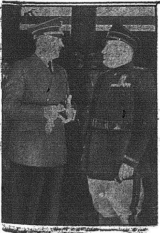
Zdjęcie ostatniego, dziesiątego już z kolei spotkania Kanclerza Hitlera i Mussoliniego, które, jak wiadomo, nastąpiło w Brennerze, alpejskiej stacji granicznej. Rozmowa, która dotyczyła jest ośrodkiem zainteresowania kół politycznych całego świata, utrzymana była w serdecznym tonie przyjaźni, łączącej narody niemiecki i włoski.

Nie mogąc sama interweniować, posługiwała się agentami eksgenerała de Gaulle'a. Po raz trzeci wyszły na law plany brytyjskie w stosunku do Syrii po ostatniej klęsce bałkańskiej. Dla zrozumienia sytuacji w Syrii należy zaznaczyć, że w kraju tym żyje około 180.000 prawosławnych i 100.000 gregoriańskich Armeńczyków. Syria jest wśród wszystkich krajów arabskich najlepiej rozwiniętą dzięki bogatej, starej kulturze oraz tradycjom walk wolności-