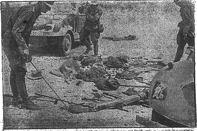
Osobliwy sprzęt wojenny Anglików. — Żołnierze niemieckiego korpusu afrykańskiego przy zdobytym sprzęcie i kijach do hokeya i golfa.