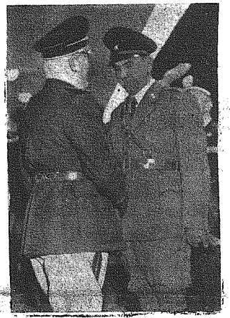
Na lewo: Książę Spoleto, król Chorwacji. — Na prawo: Mussolini ściska dłoń dra Pavelića, Poglawnika Chorwacji.