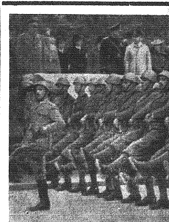
Fototelegram z Wenecji gdzie odbyła się ostatnie niemiecko-włoska defilada wojskowa. Włoskie oddziały maszerują „Passo Romano” wobec niemieckich i włoskich dowódców.

Paryż, 15 maja. — Żyjacy w Paryżu mahometani zehrali się w paryskim meczecie celem przesłania narodów irackiemu orędzia zapewnającego o ich przyjaźni. Członkowie północno-afrykańskiej sekcji „nacionalistów” muzułmańskich rozkolportowali w Paryżu ulotkę w której m. in. powiadzano, że wobec angielskiego ataku na Irak wszyscy wyznawcy islamu muszą uważać się w stanie „wzajemnej wojny przeciwko Anglii i żydowskiej kliwie, która ją opanowała. Rzym, 15 maja. — Iracki komitet obrony w Damaszku postanowił — według nadszchodzących tu wiadomości — urządzić w