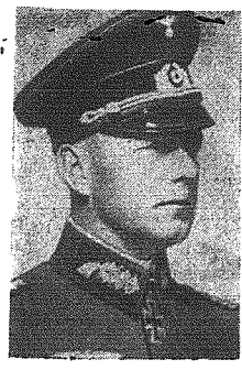
Gen.-pulk. v. Kleist