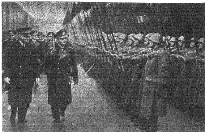
Admiral Raeder we Włoszech

Dzięki dalszym sukcesom jednostek marynarki wojennej ogólne straty nieprzyjaciela w tonażu handlowym według stanu i meldunków z dnia dzisiejszego wyniosły 217.300 BRT.