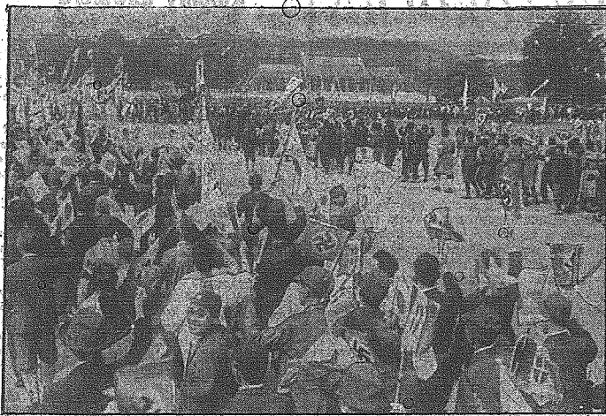
Do Europy dopiero obecnie doszła z Tokio, dokonane w dniu, gdy tam nadeszła wiadomość o podpisaniu Paktu Trzech. — Rozentuzjowana ludność udaje się przed pałac cesarski.