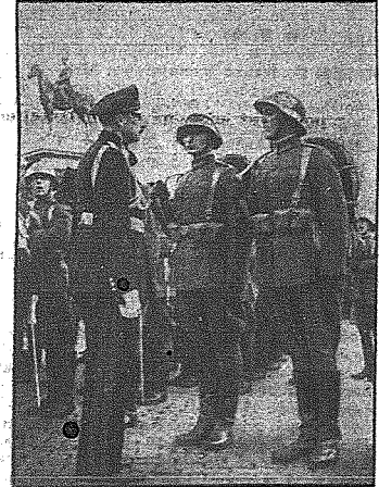
W Sofii król bułgarski Borys III otworzył parlament mową tronową. — Nasz obrazek przedstawia króla Borysa przed frontem formacji honorowej w rozmowie z żołnierzami.

Anglia nie nadesłała gratulacji Rio de Janeiro, 9 listopada. — Jak urzędowo komunikują otrzymał prezydent Brazylii Vargas z racji 10-lecia piastowania godności głowy państwa gratulacyjne telegramy od najwyższych dostojników państwowych Niemiec, Włoch, Japonii, Hiszpanii, Chile i Rumunii.