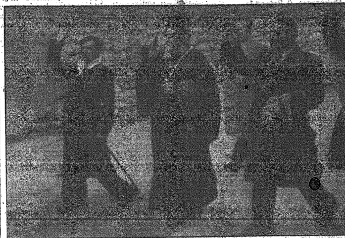
Albańczycy, mieszkający w Grecji. Witają zwycięskie wojska włoskie. (Foto-telegram z frontu nad rzeką Kalamas).

Owacje ludności w Tuluzie i w Marsylii Zurych, 9 listopada. — Sześć państwa francuskiego marszałek Pétain udał się w podróż wizytacyjną do południowych departamentów Francji, do Tuluzy i Marsylii. W podróży tej towarzyszą mu sekretarz stanu Paweł Baudoin i minister spraw wewnętrznych Peyrouton. Agencja Havasa donosi, że marszałek Pétain był wszędzie serdecznie witany przez ludność.