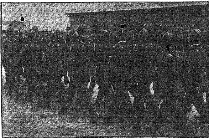
Defilada oddziałów Straży Ochrony Lasów przed Generalnym Gubernatorem Generalny Gubernator Dr Frank objął komendę nad oddziałami Straży Ochrony Lasów. Zadaniem Straży Ochrony Lasów jest w pierwszym rzędzie rozbudować na obszarze Gubernii Generalnej rozzumną gospodarkę leśną.

Kiedy o świcie dnia 9 kwietnia wojska niemieckie na kilka godzin przed planowanym zamachem brytyjskim na neutralność Danii i Norwegii objęły zbrojną ochronę tych krajów i jednym rzutem strategicznym obsadziły najważniejsze punkty pomiędzy Esbjerg i Narvik, wówczas Londyn i Paryż kpiły sobie z tej akcji niemieckiej i oceniali ją jako nieudolne kłamstwo propagandy niemieckiej. Kiedy jednak następnego zaraz dnia pierwsze ataki lotników niemieckich porwały z nowych punktów oparcia w Skandynawii wyrwać potężne łuki w eskadrach marynarki brytyjskiej, wówczas Londyn spuścił nieco z tonu i stwierdził, że wprawdzie wojska niemieckie wylądowały w Skandynawii, jednak akcja niemiecka jest skazana na niepowodzenie, ponieważ Wielka Brytania „panująca nad morzami” przygotowuje obecnie przeciwdzierzenie i uprzędzi Niemców. Faktycznie Anglicy wysadzili wojska w portach Namsos i Andalsnes, zupełnie nienadające się do operacji w większym stylu. Wojska te były następnie narażone na nieustanne ataki lotnictwa niemieckiego i poniosły ciężkie straty. Ukazanie się na terenie wojny brytyjskiego korpusu ekspedycyjnego pod żadnym względem nie zahamowało operacji niemieckich. Planowo rozszerzano i rozbudowywano zajęte pozycje niemieckie marynarka wojenna zabezpieczała dopływ rezerw i oczyszczała wody przybrzeżne z nieprzyjacielskich łodzi podwodnych, a lotnictwo niemieckie atakowało dzień po dniu brytyjskie okręty wojenne i transportowce i niszczyło je. Również nieprzyjacielskie ataki powie-