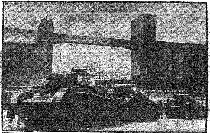
Pancerniki niemieckie na ulicach Oslo Niemieckie oddziały wojskowe ze sprzętem wojennym wylądowały na wybrzeżu Norwegii. Również i olbrzymie pancerniki przebyły drogę morską i obecnie wylądowane zostały w Oslo.