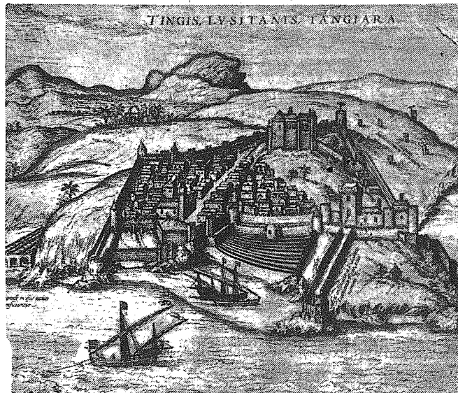
Tanger według starego sztuchu w XVI w