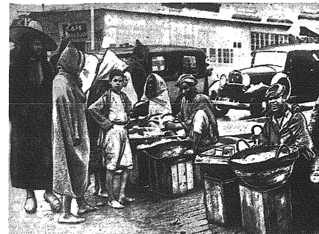
Obrazek z targu w Tangerze.

ność marokańskiego Tangeru*gospodarzo i kulturalnie