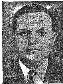
ZYD LEON BLUM mały również do kompletu redakcyjnego „Populaire”.