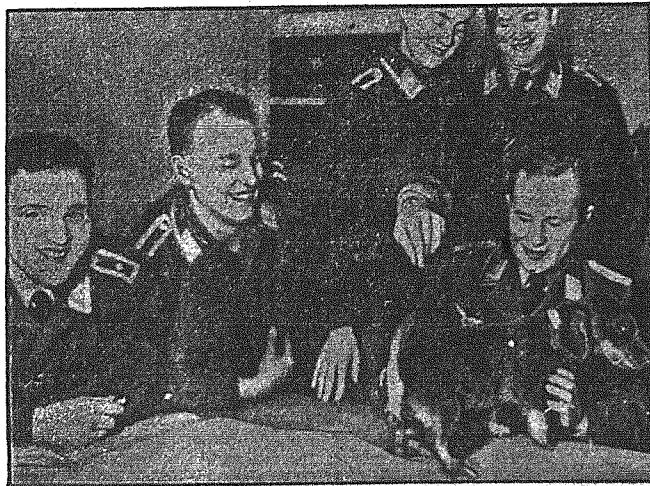
Młody pies przechodzi przeszkolenie. Weselą acenę nauki młodego psa przedstawia nasza ilustracja.

Na Bornholm nowa burza śnieżna odebrała wszelkie nadzieje, by można było znów podjąć komunikację. Kolej stały już od trzech dni, również i komunikacja autobusowa nie funkcjonuje. Transporty środków żywnościowych odbywają się na sankach. Szkoły zostały na białą trzcinę zamknięte.