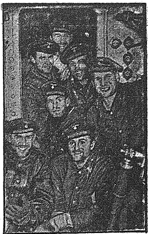
Powrót z wyprawy na wroga. Po zwycięskiej walce z wrogiem powrót do domu macierzystego.

„Dagbladet” publikuje wstrząsający opis nieprawdopodobnego wprost stanu we francuskich obozach dla internowanych i powołuje się przy tym na artykuł zamieszczony w amerykańskim tygodniku „The Nation”. Gazeta opisuje kwatery, które znajdują się pod gołym niebem, niedostateczne zaopatrzenie w środki żywnościowe i pisze dalej w ten sposób: „międzynarodowa prasa demokratyczna nie uczyniła dotychczas nic lub bardzo mało dla kwestii położenia w francuskich obozach koncentracyjnych, częściowo tylko pewnie dlatego, ażeby nie dostarczyć Niemcom materiału. Ale tu chodzi o okoliczności, które szkoda międzynarodowej opinii Francji”.