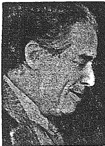
ZYD PERTINAX zwyczajny gatunek publicysty żydowskiego.

Program „rozkałkowania Niemiec”, który przed paru dniami opublikował na łamach „Daily Telegraph” żydowski publicysta Pertinax nie jest jednorazowym wystąpieniem żydowsko - francuskich podżegaczy prasowych, lecz stanowi zjawisko symptomatyczne dla stanowiska, polityki i stosunków prasowych, które bez wyjątku pozostają pod dyktandem żydowskich plutokratów i ich popleczników.