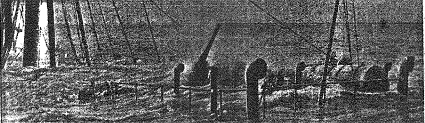
„Oto co pozostało z okrętu „Dunbar Castle” pisze „Daily Herald” zamieszczając powyższe zdjęcie, przedstawiające zatopiony wrętek wybuchu miny 10000 tonowy brytyjski okręt handlowy. Treść zamieszczona przez gazetę angielską stoi w rażącej sprzeczności z oświadczeniami pierwszego lorda brytyjskiej admiralicji, który uważał niebezpieczeństwo ze strony min niemieckich za całkowicie zażegnane. Jako dowód pogwałcenia praw międzynarodowych sterczy spod wody lufa armatnia.