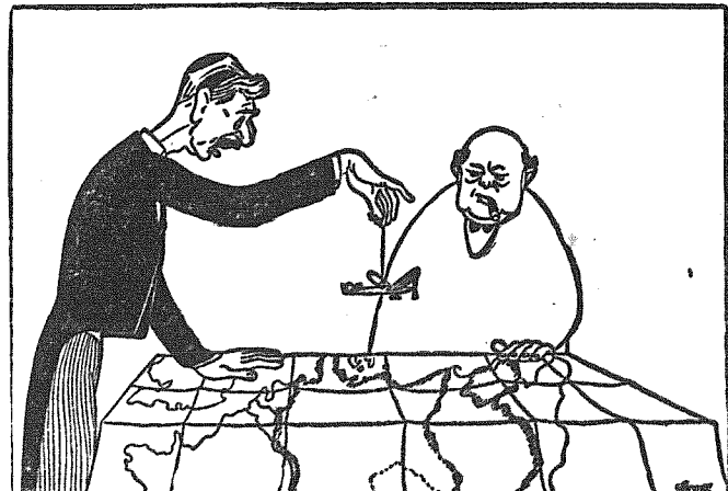
Churchill: „Co ty robisz, Neville?” Chamberlain: „Dokonuję lotu wywiadowczego nad Niemcami aż do Czech” Angielska strategia.

Bezpieczeństwo Na pustej ulicy w nocy: — Przeczaram pana, czy nie widział pan policjanta w pobliżu? — Nie, panie. — A nie wie pan, gdzie jest najbliższy posterunek policji? — Nie, nie wiem. — No... to nikt nam nie przeszkodzi, mój panie. Niech pan oddaje swój portfel.