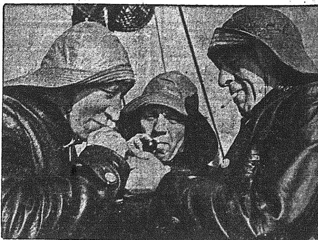
Trzech członków załogi kutra rybackiego, który przeznaczony został do poszukiwania min na Morzu Północnym.

Zarządzona przez władze racjonalizacja masła w Anglii wywołała prawdziwą demonstrację wśród szerokiej kół wegetarianów. Związek wegetarianów wysłał do ministerstwa żywności depu-