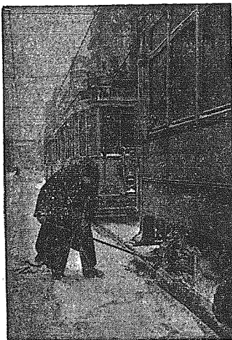
Komunikacja w mieście była przez pewien czas mocno utrudniona.