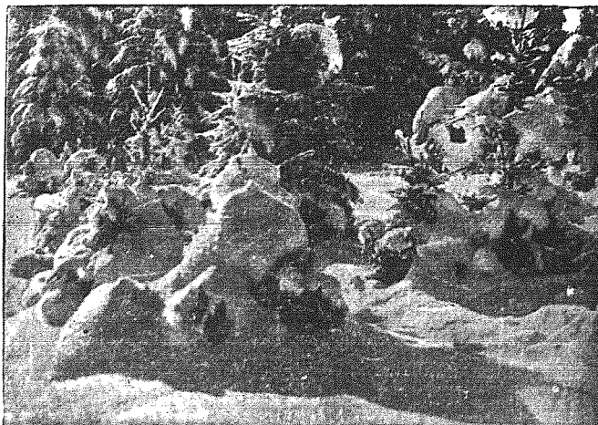
Las w szacie śnieżnej.

Następnie chodzi również o przerobienie bezwodnika węglowego oraz o izolację helu, argonu i innych gazów szlachetnych.