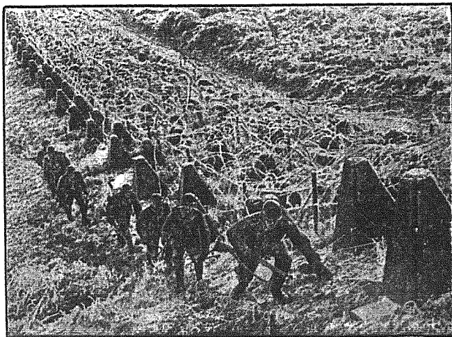
Wal zachodni w Biell Inlegu. Droga na przedpolu fortyfikacji. Żołnierze wspinają się po zamrzniętej pochyłości. „Żeby kołczaste” stanowią doskonałą broń przeciw czołgom.

O pożarze w Shizuoka donoszą, że dotychczas żywiło nie zdołano opanować. Wciąż, niż 4.000 domów spaliło się doszczętnie. Coraz bardziej atakujące płomienie zagroziły ratuszowi, budynkom policji oraz byłej rezydencji książęcej. Przybyły dalsze oddziały ratownicze z okolicy.