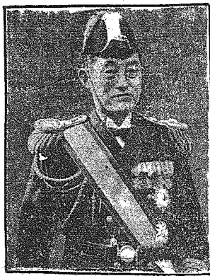
Nowy szef gabinetu japońskiego. Po dymisji gabinetu Abe'go misję utworzenia nowego rządu japońskiego otrzymał admirał Yonai.