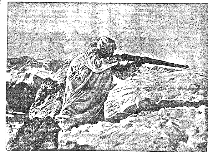
Zołnierze niemieccy ze znacznikiem szarokci.

W innych krajach południowej Europy, jak Hiszpania, Grecja, również zdarzają się dotkliwie zimna, co prawda bardzo krótkotrwałe. Śnieg znika szybko, a po kilku dniach zimniejszych następuje znowu pogoda pełna promiennego słońca.