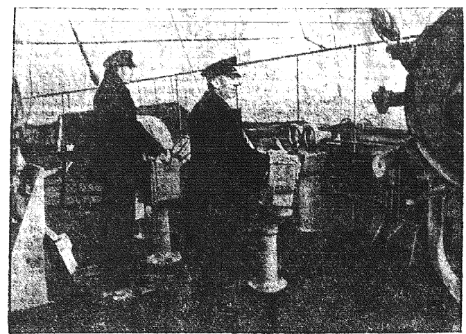
NA MOSTKU KAPITANSKIM NIEMIECKIEGO OKRETU POMOCNICZEGO DLA LOTNICTWA. Skoro tylko drogą radiową nadejdzie wiadomość, że wodnopłatowiec musiał wodować, natychmiast na wskazane miejsce wyrusza okręt.