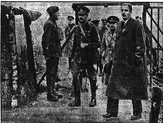
Znany niezaszczytnie zrosztą angielski minister dominiów, Anthony Eden, ostatnio przybył do Francji i odwiedził front. Dotychczas wiedziliśmy z oficjalnych komunikatów o tej wizycie, że złożył się na nią śniadania i kilka obiadów, w których Eden wziął udział. — Ilustracja nasza przedstawia Księcia Gloucester (na lewo), który jest oficerem łącznikowym między armią francuską i angielską oraz ministra dominiów (w ubraniu cywilnym) w czasie wizyty „na froncie”. Nie wygląda „piękny Anthony” na składającego wizytę na froncie.

Aresztowany w Niemczech funkcjonariusz brytyjskiej tajnej agencji Secret Service, kapitan Stevens, stwierdził istnienie grupy sabotażystów, dokonujących aktów terrorystycznych na okrętach przy oddziale propagandowym Secret Service. Wymki poszukiwani niemieckiej Gestapo pochodzą z pierwszorzędnego źródła.