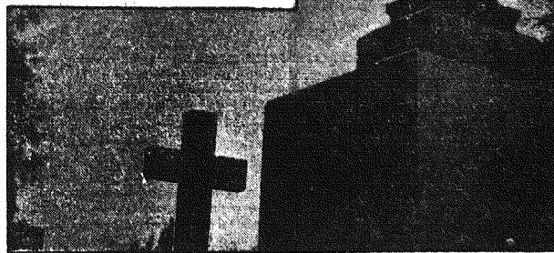
Czcijmy pamięć Zmarłych