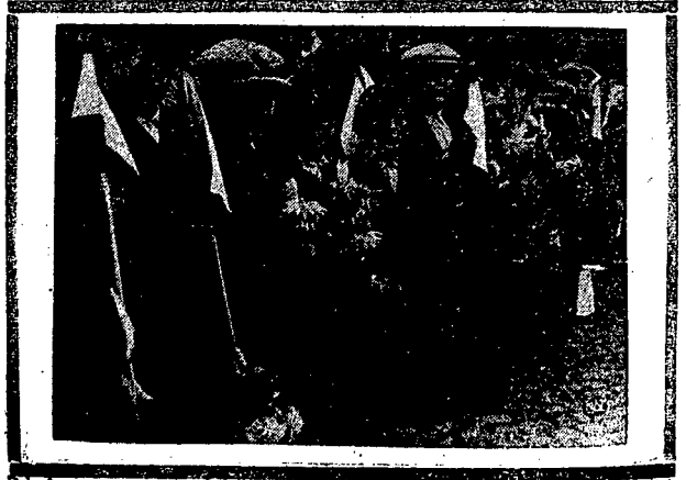
Dzieci z narcyzami kwiatów w radoznym oczekiwaniu na wkroczenie wojsk polskich...