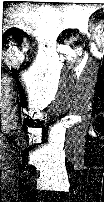
Akcja pomocy zimowej w Niemczech. Kanclerz Hitler składa datkę na rzecz pomocy zimowej, podczas powszechnej zbiórki ulicznej.