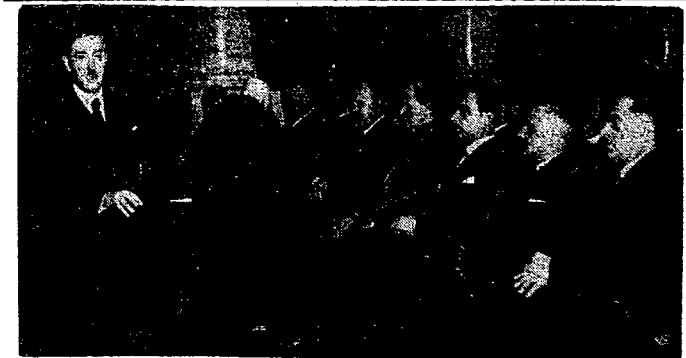
36-lecie Warszawskiego Towarzystwa Naukowego.

Noc boju, Czyna nieśmiertelnej sławy. Z.