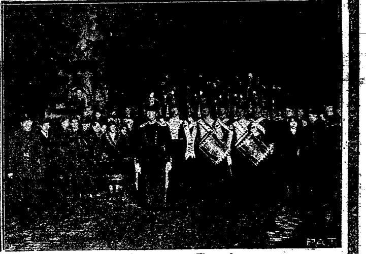
Fragment defilady podchorążych w historycznych mundurach podczas obchodu rocznicy Powstania Listopadowego w Warszawie; P. Prezydent Rzeczypospolitej przed frontem kompanii honorowej podchorążych oraz capsiarzy na ulicach stolicy.

stwa i dzielności naszego żołnierza. Historia wyświeciła już niemal wszystkie okoliczności, które wywołać musiały wojnę z carem Mikołajem, mieniącym się „królem polskim”, wojnę zakończoną klęską. Ocenione zostały sumiennie i zasługi i błędy bohaterów dni listopadowych. W świadomości narodu, tkwi prawda niezbita, że ten krwawy wysiłek został nie stęty zmarnowany, choć mógł łatwo przeistoczyć się w triumf wielkiego zwycięstwa. Zamiast klęski mogło nastąpić odzyskanie niepodległości.