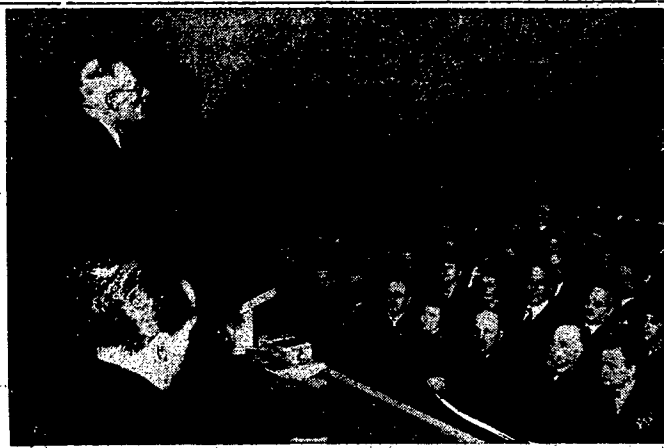
Znakomity apolityk angielski p. Hugh Rutledge w Polsce.

Na odczyt przybyło kilku Słowaków, którzy stwierdzili w sposób bardzo stanowczy, że w narodzie słowackim nie ma różnicy zdań, co do tego, czy Słowacy są odrębnym narodem. Cały naród słowacki opowiada się za hasłem „W Słowacki po słowacku“ i przeciwstawia się energicznie wszelkim próbom czechizacji tym na terenie Słowacji. Jeśli w tej kwestji centraliści mają jakiegokolwiek wątpliwości, to najlepiej byłoby urządzić w Słowacji plebiscyt.