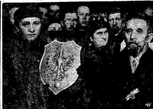
Pierwszy ogólnopolski zjazd P. O. W. w Wilnie.