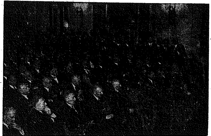
XX-lecie sądownictwa polskiego.

Zróżdka japońskie twierdzą, że rząd japoński ponownie odrzuci zaproszenie do wzięcia udziału w konferencji brukselskiej.