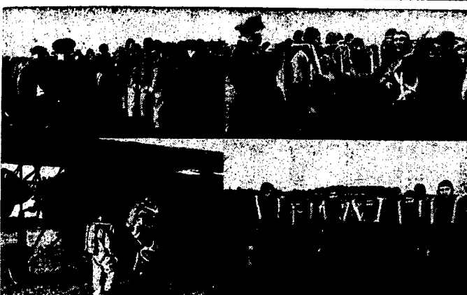
Propaganda skoków spadochronowych

NADPROGRAMY. Początek o 5 m. 30, 7 m. 30 i 9 m. 30.