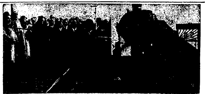
Uroczyste otwarcie nowej linii Kolejowej Sierpc—Brodnia.