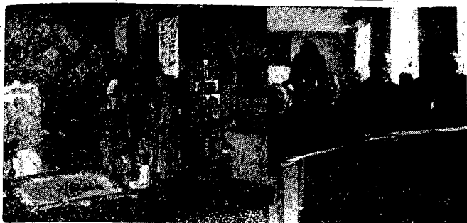
Otwarcie Wystawy Misyjnej.

W Warszawie została otwarta Wystawa Misyjna, zorganizowana przez Zgromadzenie Księży Misyjnych i Sióstr Miłosierdzia. W trzech salach wystawowych przedstawiono dorobek misyjny na placówce w Chinach w miejscowości Shuntienfu, oraz zobrazowano wyniki osiągnięte przez misjonarzy w Brazylii i Afryce. Na wystawie zostały umieszczone m. in. obrazy z czasów przesiedlania chrześcijan w Chinach, urny do palenia kadzidła ku czci pogańskich bożków, trofea myśliwskie i t. p. Zdjęcie nasze przedstawia w fotomontażu: na lewo rzut oka na jedną z sal wystawowych, zaś na prawo — moment przecięcia wstęgi przez J. Em. ks. kard. Kakowskiego.