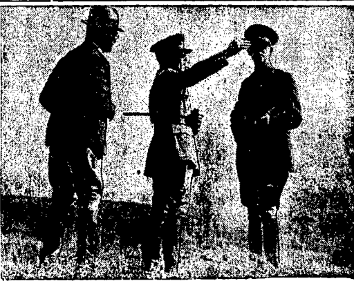
Król grecki na manewrach.

Wśród mieszkańców rozpoczęła się już zbiórka w naturze na ten cel. Wreszcie władze nakazały 30 miejscowym chło-