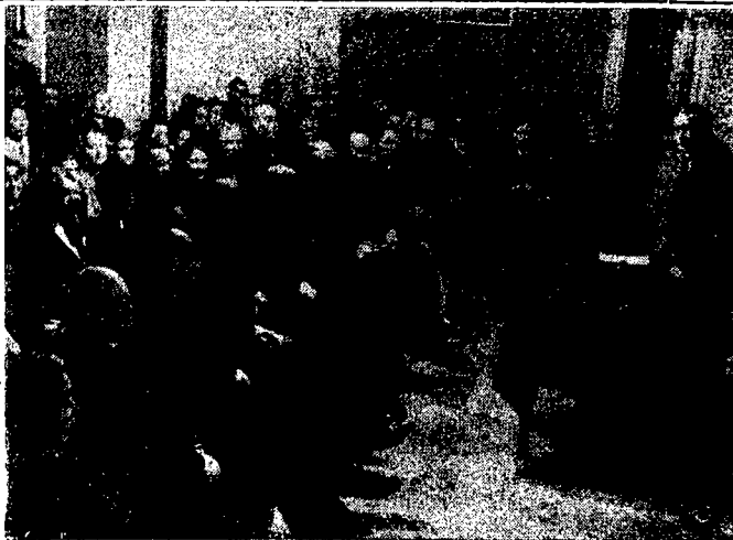
Akademia w 385-a rocznicę upadku Chanatu Kazańskiego.

Taśma papierowa podgumowana do uszczelniania okien w Księgarni i Sklepie „Gońca” II Aleja 26.