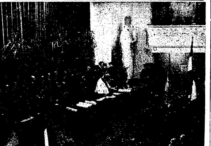
Święto Szkoły Głównej Gospodarstwa Wileńskiego. Szkoła Główna Gospodarstwa Wileńskiego obchodziła uroczystość 30-letniego swego istnienia. Uświetniono promocję Pana Prezydenta Rzeczypospolitej na doktora honoris causa. Kulminacyjnym punktem uroczystości była wielka akademja jubileuszowa w Domu Katolickim im. Piusa XI-go. Pana Prezydenta Rzeczypospolitej, który z powodu niedyspozycji nie mógł wziąć udziału w uroczystości akademji, reprezentował minister W. R. i O. P. prof. Świątosławski. Zdjęcie nasze przedstawia rzut oka na prezydium akademji. Widzimy senat akademicki S. G. G. W. w uroczystych togach.

Zydzi zagłębiowscy chcieli być solidarni, to też „zastrajkowali”. Część z nich w Sosnowcu i Będzinie zamknęła swe sklepy od godziny 8—12-iej, jednak mimo to handlowała „przez sieni”. Szkoda im było stracić zarobku. Jednym słowem strajk nie udał się. W każdym innym wypadku żydzi są solidarni, kwestia zarobku jednak jest dla nich ważniejsza od in-