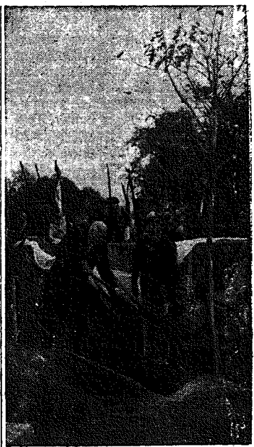
Zulów własnością całego narodu. W niedzielę odbył się uroczysty akt przekazania Narodowi przez Zarząd Główny Związku Rezerwistów odbudowanego Zulowa, miejsca urodzenia Marszałka Józefa Piłsudskiego. Zdjęcie przed stawia moment zasadzania przez Pana Prezydenta Rzeczypospolitej złotolitego drzewa w miejscu urodzenia Marszałka Józefa Piłsudskiego

Bilbao. — Obecnie nadeszła tu wiadomość o zupełnym zniszczeniu przez miłośników walencką miasta Cangas de Onis. — Górnicy asturyjscy, cofając się z miasta pod naporem wojsk narodowych, wysa-