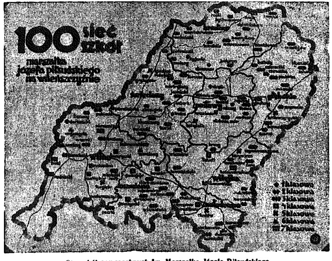
Sto szkół powszechnych im. Marszałka Józefa Piłsudskiego. Zgodnie z uchwałą Rady Ministrów, zapadła po śmierci Marszałka Józefa Piłsudskiego, jednym z aktów uczczenia pamięci Marszałka miała być budowa stu szkół powszechnych im. Marszałka Józefa Piłsudskiego na Wileńszczyźnie. W dniu 10 b. m. odbyła się w Bezdanach, w obecności najwyższych przedstawicieli Państwa uroczystość symbolicznego oddania do użytku społeczeństwa stu szkół powszechnych im. Marszałka Józefa Piłsudskiego. Na zdjęciu naszym mapka sytuacyjna wyżej wymienionych szkół.

Bojówka okupowała dworzec i przez kilka godzin trzymała tam jako zakładnika burmistrza Erzy. Żandarmeria uwolniła burmistrza i po długich pertraktacjach zdołała przeprowadzić uchodźców na inny dworzec.