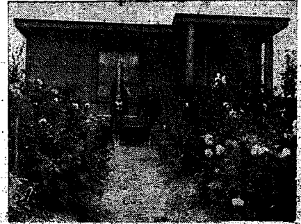
1) — Dobroczynna akcja Funduszu Pracy. Jeden z domków, wybudowanych na terenie woj. poznańskiego przez Fundusz Pracy dla rodzin bezrobotnych. Bezrobotnym tym zostały również przydzielone działki ogrodowe. 2) — Nowe Eutry ze stoczni polskiej „Orlik” i „Kania”. Widzimy również cztery dalsze kutry, które są już na ukończeniu i wzmocniła nasza flotylla rybacka. 3) Młodzież japońska szkoli się w pilotażu. Na zdjęciu widzimy grupę młodzieży japońskiej, szkolącej się na lotników. 4) Cwiczenia w obronie bierności przeciwgazowej i przeciwlotniczej, którym to zainteresowaniem przylegają się uczniowie japońskie.