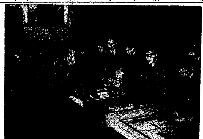
Wystawa „Zycie Literackie” w saliach P. A. L.

Początek dziś 5 m. 30, sobota o g. 4-iej, niedziela o g. 3-iej.