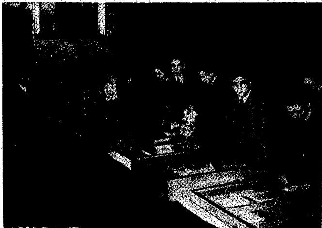
Wystawa „Życie Literackie” w salach P. A. L.

Minister oświadczył, że podczas ostatniego zjazdu rektorów zwrócił się do nich z apelem, aby w oparciu o ustawę akademicką i odpowiedni jej ustęp, upoważniająca rektorów do wydawania zarządzeń porządkowych, usiłowali utrzymać ład i porządek na uczelniach akademickich, starali się zapobiec gwałtom i użyli wszystkich środków, aby nie dopuścić do bójek i używania przemocy w