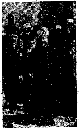
Surowe represje administracji mandatowej przeciwko Arabom palestyńskim.

W robotniczych okręgach Kemerowa rozszło się wyborcom legitymacje, wypełnione „kontrewolucyjnymi” hasłami. Legitymacje miały podpis prezesa „gorsowietu”, sekretarza komitetu partyjnego, i zaopatrzone były w pieczętę urzędową. Dotychczas nie udało się wykryć sprawców tej niezwyklej afery.