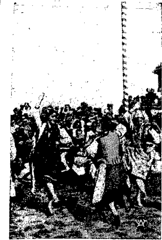
Winoبرانہ w Zaleszczykach. Z okazji winoبرانہ odbyły się w Zaleszczykach popisy i tańce, w czasie których Podolacy wystąpili w pięknych ludowych strojach.

GEN. VARELA RANNY? Madryt. — Według nadeszłych tu wiadomości, wczoraj wieczorem, w czasie bombardowania baterii powstańców, ustawionych w Cerro Carabitas, przez artylerię rządową, dowódca wojsk powstańczych na froncie Madrytu gen. Varela został zraniony odłamkami pocisku. CZERWONI WYSYLAJĄ KOBIETY NA FRONT.