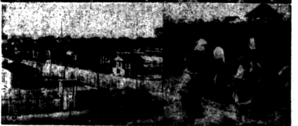
1, 2 i 3) — Z PAMIĘTNYCH DNI POBYTU (OGÓLNOPOLSKIEJ) PIELGRZYMKI MEŻÓW KATOLICKICH NA JASNEJ GÓRZE. — W sobotę i niedzielę ponad 80.000 samych mężczyzn stanęło pod murami Jasnej Góry w I ogólnopolskiej pielgrzymce meżów katolickich. Imponujący ten zjazd wywarł wielkie wrażenie nie tylko w samej Częstochowie, ale w całym kraju. Oto zdjęcia z tych pamiętnych dni: 1) ryngal złożony przez pielgrzymkę u stóp Cudownego Obrazu Matki Boskiej Częstochowskiej; 2) trybuna podczas defilady uczestników zjazdu na placu ratuszowym, na czele widoczni: J. Em. ks. Kardynał Hlond, Prymas Polski, oraz J. E. ks. Nuncjusz Cortesi; 3) fragment szczytu Jasnej Góry i nieprzebrane rzesze meżów katolickich na placu podszczytowym podczas nabożeństwa. — 4) MOST IM. MARSZAŁKA EDWARDA ŚMIGŁEGO - RYDZA. Zdjęcie nasze przedstawia rzut oka na nowo zbudowany wspaniały most imienia marszałka Edwarda Śmigłego - Rydza na Wiśle we Włocławku, którego uroczyste poświęcenie nastąpi w sobotę, dnia 25 września. 5) WSZECH POLSKI KONGRES TOW. OGRÓDKÓW DZIAŁ. KOWYCH. W dniach 26 i 27 września odbył się w Warszawie V-y wszechpolski kongres delegatów Towarzystw Ogródków Działkowych. Zdjęcie nasze przedstawia na lewo — rzut oka na typowy ogródek działkowy, zaś na prawo — dzieci bezrobotnych przy uprawie ogródka.