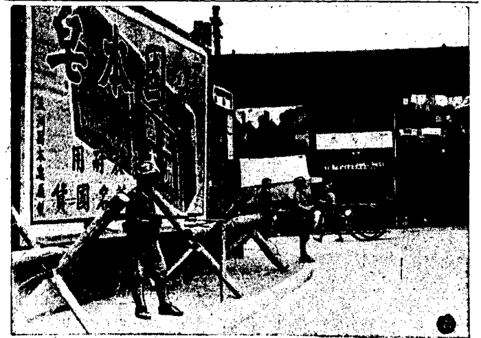
Luna wolenna nad Chinami. Na zdjęciu widzimy oddziały marynarzy japońskich, stojące za barykadami z drutów kolczastych i jednym z opanowanych przez Japończyków przedmieść Szanghaju.

Paryż. — Z nowych elementów, wniesionych do dochodzenia, prowadzonego w związku z tajemniczym zniknięciem gen. Millera, zasługuje na uwagę jeden szczegół, który może posiadać znaczenie dla dalszego biegu śledztwa. Gdy gen. Miller objął po gen. Kutie-