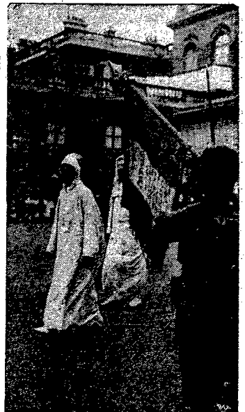
Sultan Marokka w Paryżu. Dziecię nasze przedstawia sultana marokańskiego, opuszczającego go honorami, przystępującemu głowom państw, pałac prezydenta republiki Lebuna, po śniadaniu, wydanym na cześć sultana

Katowice. — W czwartek, jako w ostatni dzień ważności konwencji genewskiej, odbyło się w sposób uroczysty ostatnie likwidacyjne posiedzenie komisji