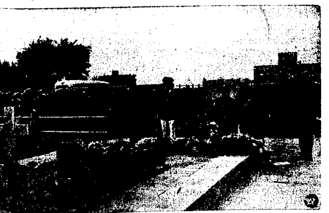
7 niedzielnego obchodu na rozpoczęcie „Tygodnia Morza” w Gdyni.