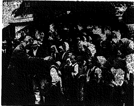
Wojewoda krakowski wśród ludności spiskiej.

Taki jest epilog nocy, epilog pierwszego aktu dramatu, który przeżył się na scenie pałacu burbońskiego. Pozostaje pałac luksemburski, czyli scena senatu, na której rozegra się akt drugi. Ze strony senatu nie należy oczekiwać posunięć zbyt śmiałych, mimo to dalszego trwania gabinetu Bluma nie należy uważać za wzmożone.