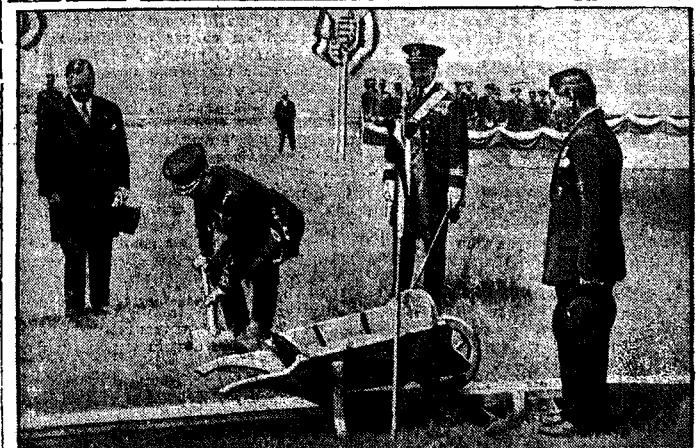
Budapeszt buduje port wolnocłowy. W Budapeszcie na Dunaju buduje się obecnie w obwodowy port. Budowę portu zapoczątkował sam admirał Horvath, wykopując i przewożąc pierwszą ciężką ziemię.

Na pytanie sędziego przysięgłego, czy miał ściśle omówiony plan wyprawy na Myślenice, oskarżony odpowiada, że plan był dokładnie omówiony, a większość jego szczegółów została wykonana. Nie miał jednak zamiaru okupować jakiegokol-